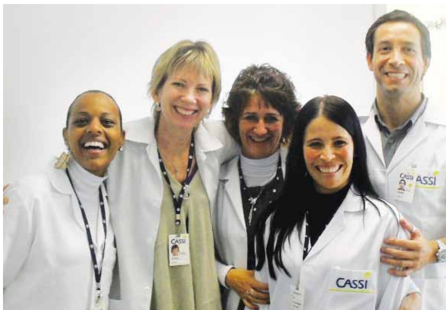
Equipe da CliniCASSI Florianópolis (SC): profissionais vacinaram mais de 400 pessoas