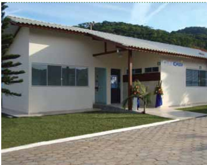
CliniCASSI Balneário Camboriú (SC)

CliniCASSI inauguradas - Os participantes da Caixa de Assistência passaram a contar com mais três CliniCASSI no segundo trimestre de 2010. Os Serviços Próprios foram inaugurados em Balneário Camboriú (SC), Vitória da Conquista (BA) e Campos dos Goytacazes (RJ). A mais nova CliniCASSI do Estado de Santa Catarina fica dentro da AABB, na Rua Palestina, 1510 - Bairro das Nações. Em Vitória da Conquista, o Serviço Próprio está localizado na Rua Siqueira Campos, nº 450 - térreo, sala 02, Centro Empresarial DMA, no Bairro Recreio. Já a CliniCASSI Campos dos Goytacazes recebe o público na Avenida Treze de Maio, 286, sala 401 - Edifício Medical Center, no centro da cidade. Todos os Serviços Próprios atendem de segunda a sexta-feira, das 8h às 18h.