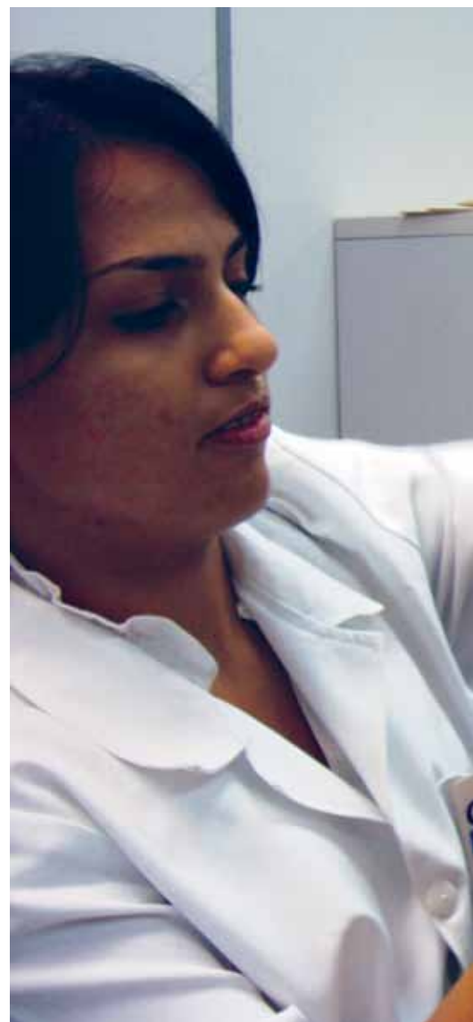
Em Macapá (AP), a CliniCASSI vacinou 364 participantes

A Unidade Amapá contabilizou 364 doses de vacina aplicadas durante seis dias de vacinação. No Pará, 835 pessoas foram imunizadas na CliniCASSI Belém. Com esta iniciativa, a CASSI reforçou um dos objetivos de seu modelo de atenção à saúde, que